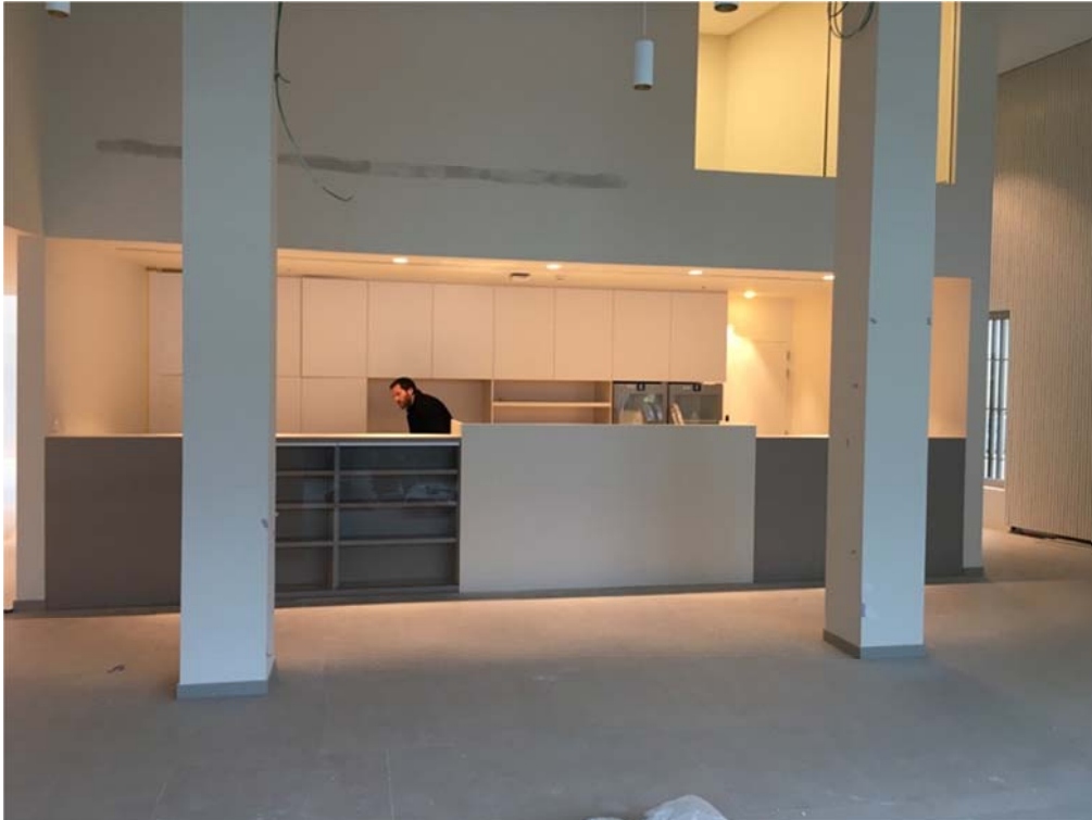
Zicht op het onthaal.