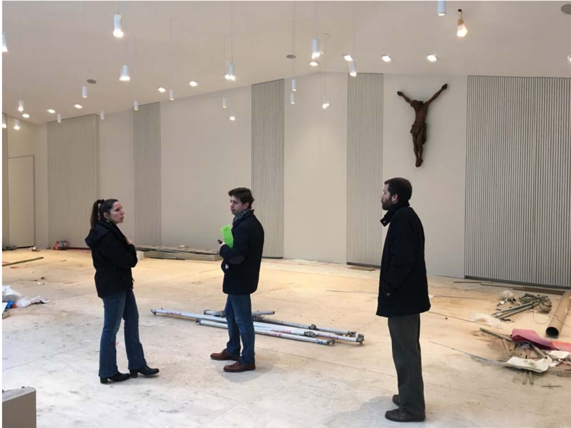
Het oude kruis uit de Voskenslaan heeft reeds zijn nieuwe plaatst gevonden.