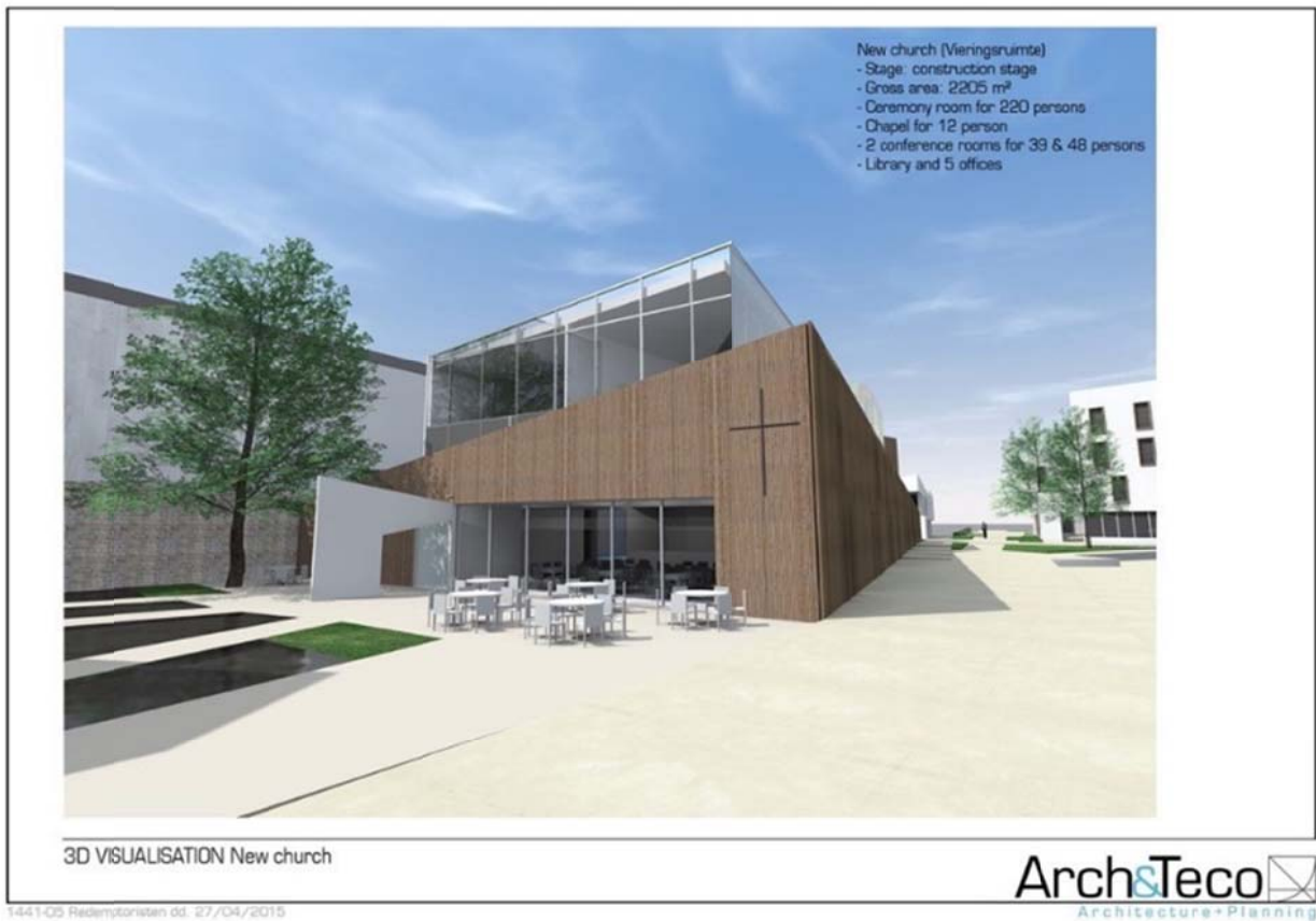
Beeld van de nieuwe kerk vanuit het "Tweekerkenplein"