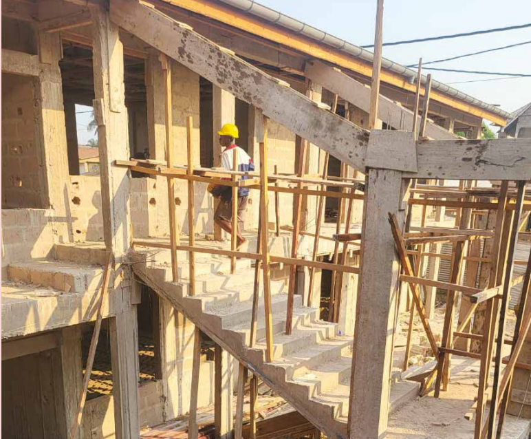
✓ Nieuwe kleuter- en lagere school in Saint-Iréné.