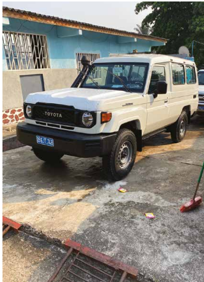
> Nieuwe jeep voor Miyamba.