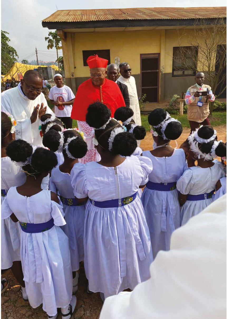
^ De aartsbisschop met meisjes die meedoen met de viering.