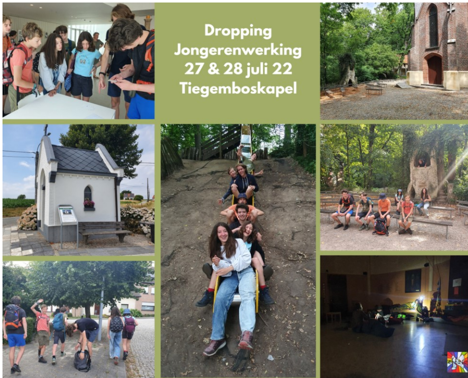
Dropping Jongerenwerking 27 & 28 juli 22 Tiegemboskapel

De jongeren van Effata uit Gent deden op 27 & 28 juli een dropping van de Tjammelberg naar Tiegemberg . Ze stapten meer dan 20 kilometer langs berg & dal, mooie landschappen en kapelletjes om te eindigen aan de bron van St.-Arnoldus aan de Boskapel. Na de grootste honger gestild te hebben aan een heerlijke koude pastasalade, verkenden ze de speeltuin, speelden een gezelschapsspel en deden een fotozoektocht bij valavond in het park.